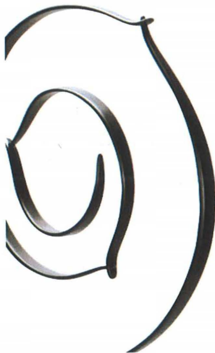
85.威尔·克里夫特 (Will Clift) 《卷入》 (Circling In)，硬木、碳纤维、钢、黑色颜料， 31×28×2cm